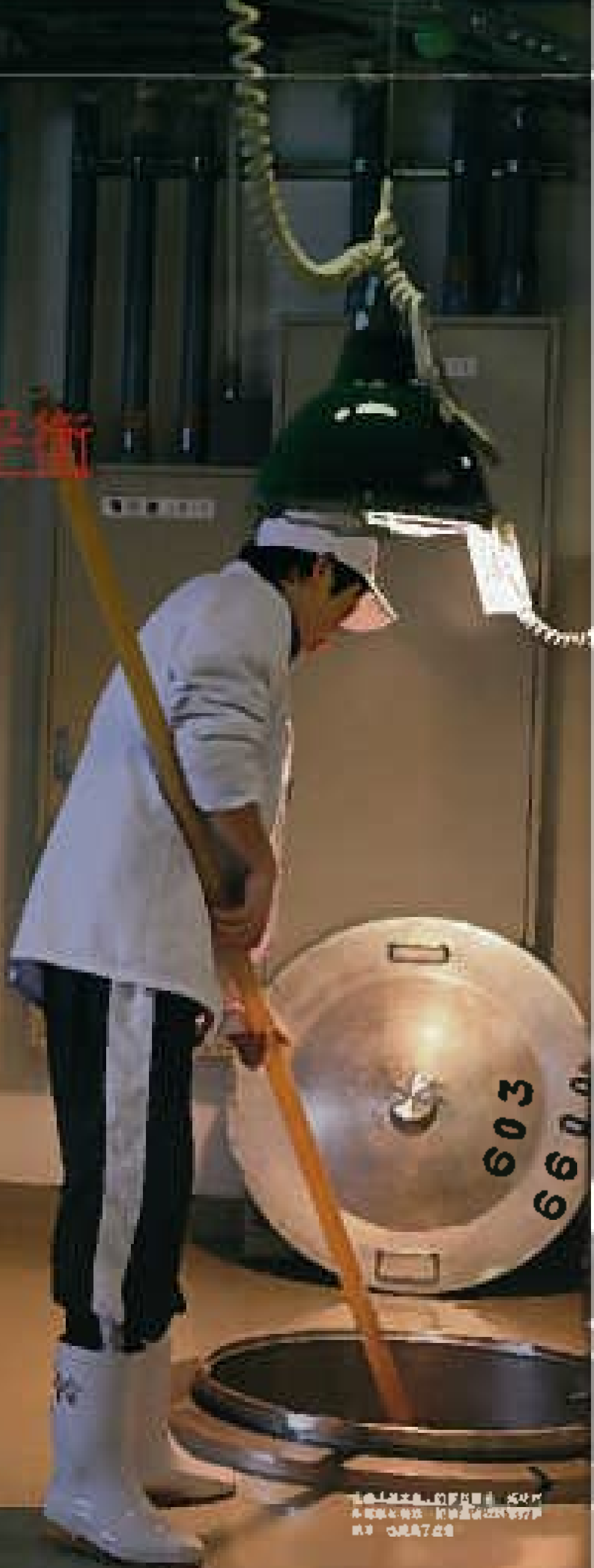
關谷釀造，位於日本，由王林創立，至今已逾五十年。其釀造出的酒類，深受市場歡迎。圖為釀造師在酒廠工作。

面對轉變，不同人有不同應對。當上世紀八十年代中，酒類市場正漸漸萎縮，各種零出揮到四方條桌的「社氏」（釀酒師）和酒師（釀酒師做）系列也在逐漸減少。這時「關谷釀造」這家以名師「王林」為日本首的釀酒師對白酒的自任酒廠，他們的品類「香取米」不單質除了提升新時代的純米大巧類「空」，打過出較清純的口感，在國內多次獲獎，而且遠銷美國。對酒師的生產模式亦作出了改革，把社氏和酒師納入酒廠長年聘用的正職人員名單上，以確保能代了部分需要大量人手的工作，增勝介入的好處，是配製酒師的專業非常精準，但又處處受到米質的質劣、溫度、氣度等條件的干擾，平台效地掌握，靈璧達到最高標準。